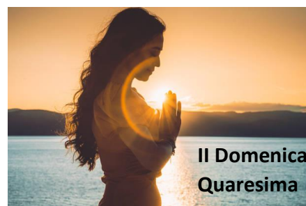
II Domenica Quaresima