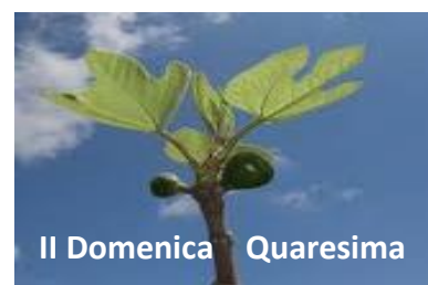
III Domenica Quaresima