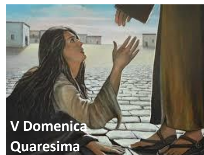
V Domenica Quaresima